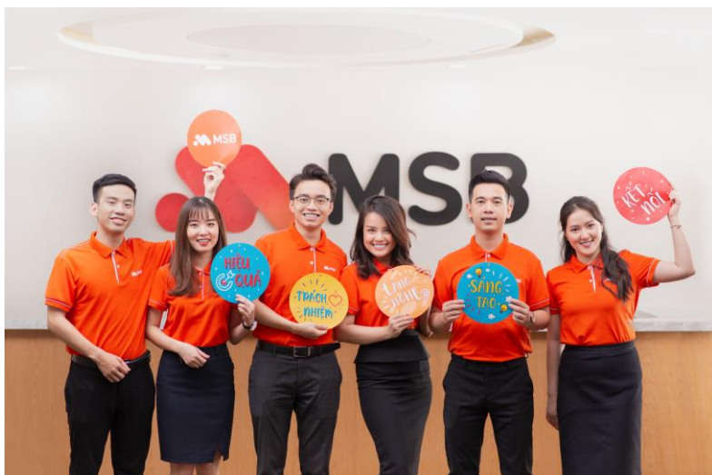
Tuyển dụng, đào tạo, tư vấn chiến lược - MSB