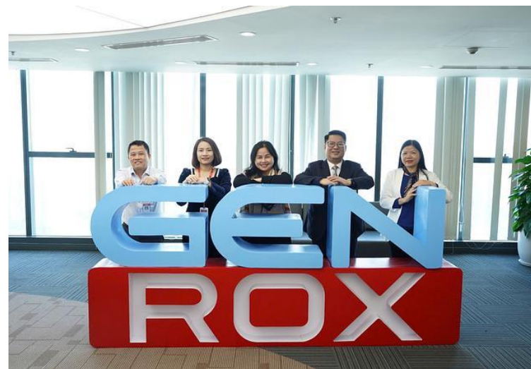
Tuyển dụng, đào tạo, tư vấn chiến lược - ROX