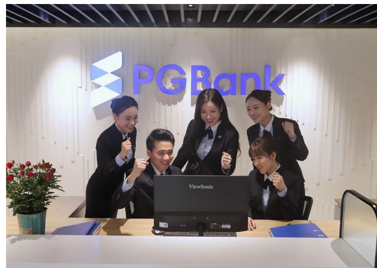
Tư vấn chiến lược nhân sự - PGBank