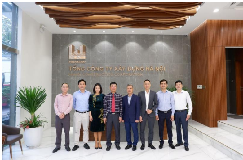
Tư vấn chiến lược nhân sự - Hancorp